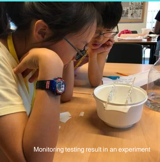
Monitoring testing result in an experiment

The first one was about Fingerprint analysis and lifting. Activity 2 was about Ink Chromatography. Activity 3 was about using chemistry to analyze the remains of a “drink” found at a crime scene. Finally, the Campers had done an analysis of their own bite marks using polystyrene cups.