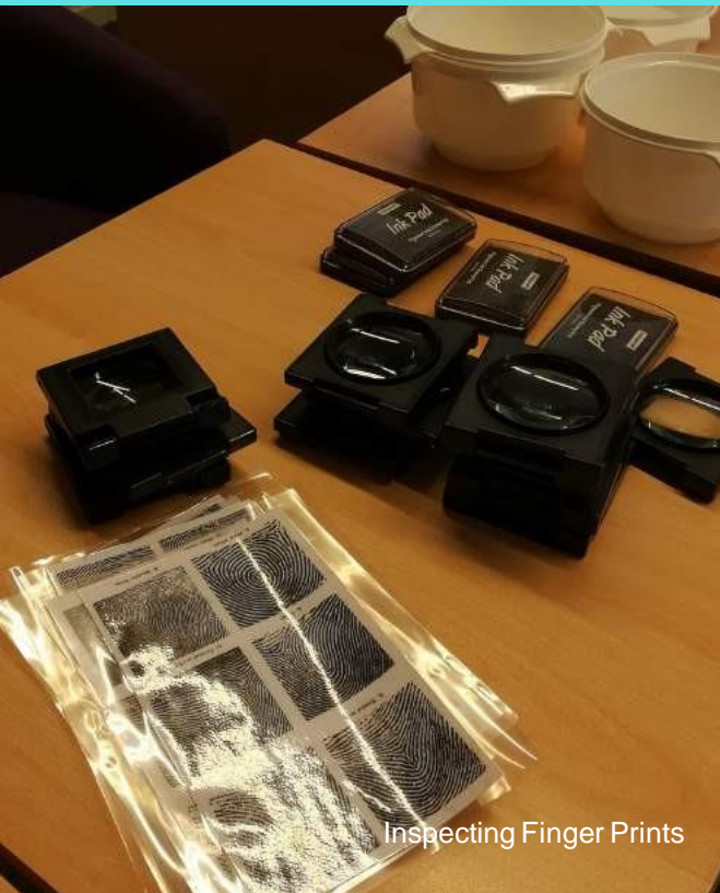
Inspecting Finger Prints

We started with a hands on Forensic Science Workshop this morning, led by a Chemistry teacher.