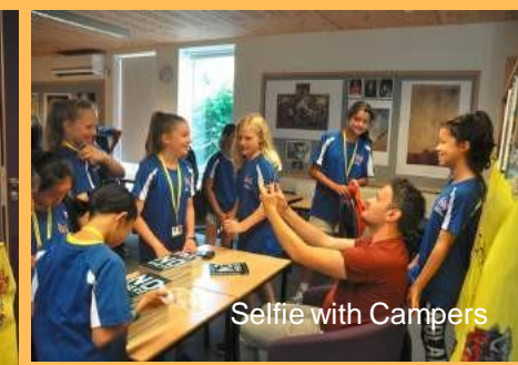
Selfie with Campers